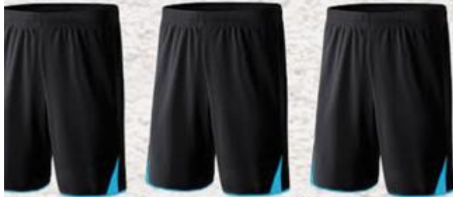
Modèle et couleur identiques