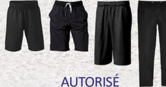
Modèle et couleur identiques